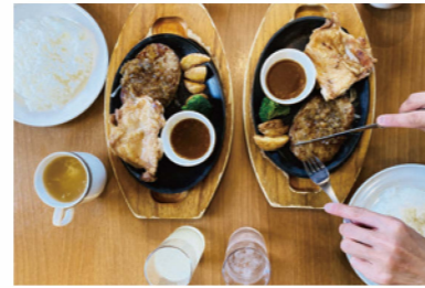
ファミリーレストラン