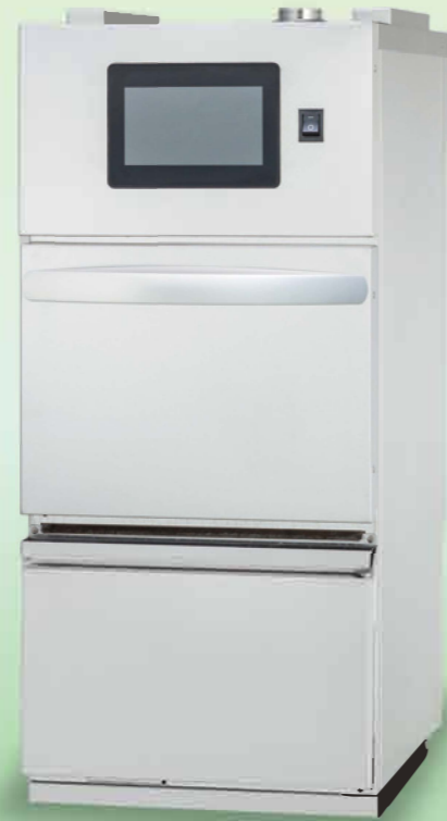
オンデマンドフライヤー