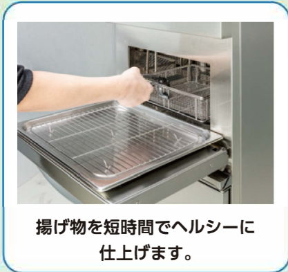
揚げ物を短時間でヘルシーに仕上げます。