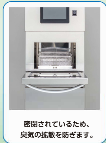
密閉されているため、臭気の拡散を防ぎます。