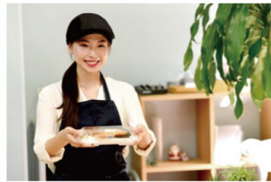
テイクアウト専門店