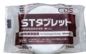
自動洗浄用タブレット

ハイブリッド軟水器カードリッジタイプ、専用洗剤、スプレーガン、オープン手袋、減圧弁自動洗浄用タブレット (TGSC-A6DWC、TGSC-A10DWC、TESC-A6DW、TESC-A10DWに付属)