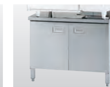
キャビネットタイプ