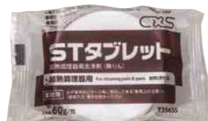
自動洗浄用タブレット

ハイブリッド軟水器カードリッジタイプ、専用洗剤、スプレーガン、オープン手袋、減圧弁 自動洗浄用タブレット (TGSC-A6DWC、TGSC-A10DWC、TESC-A6DW、TESC-A10DWに付属)