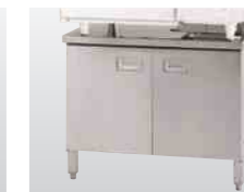
キャビネットタイプ